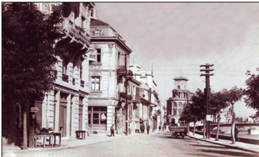
Скопскиот кеј во периодот меѓу двете светски војни